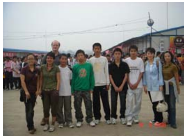
Besucher aus Deutschland mit fünf behinderten Kindern der Dongqi-Mittelschule