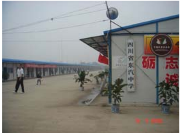
Die Dongqi-Mittelschule nach dem Wiederaufbau