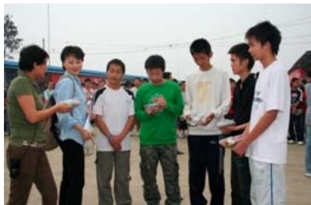
Die Schüler erhalten Musik-CDs und Schokolade aus Deutschland